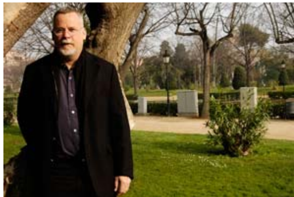
Michael Connelly.

BARCELONA. - De ex agente de la CIA curtido en una cárcel franquista a hombre torturado surgido de las calles más sombrías de LA . De Pepe Carvalho a Henry Bosch. Dos de los más populares detectives de la crónica de la novela negra comparten premio. Un galardón que recuerda la memoria de uno de ellos y premia al otro. El escritor Michael Connelly (Filadelfia, 1956) ha sido elegido Premio Carvalho 2009, un reconocimiento del Ayuntamiento de Barcelona a los grandes de la novela negra.